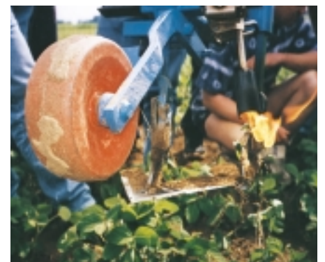
Soc patte d'oie et brûleur (O. Durant)

Généralement, les semis débutent au 1er mai. En dérobee, on pourra semer une variété très précoce jusqu'au 10 juillet.