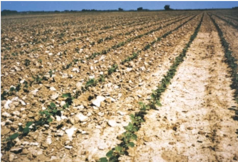
Rangs de soja après binage et brûlage en dirigé, témoin à droite (P. Mougeot),

cas, l'analyse "PCR" est également la seule garantie.