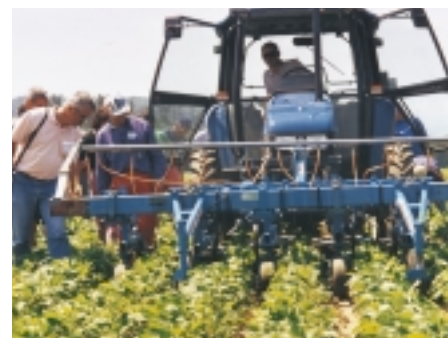
Dispositif de binage inter-rang et de désherbage thermique monté à l'avant du tracteur (O. Durant)

L'écimage mécanique peut être utilisé, il est réalisé au moyen d'outils de grande largeur qui permettent de couper les inflorescences des chardons, chénopodes ou autres plantes qui dépassent le soja.