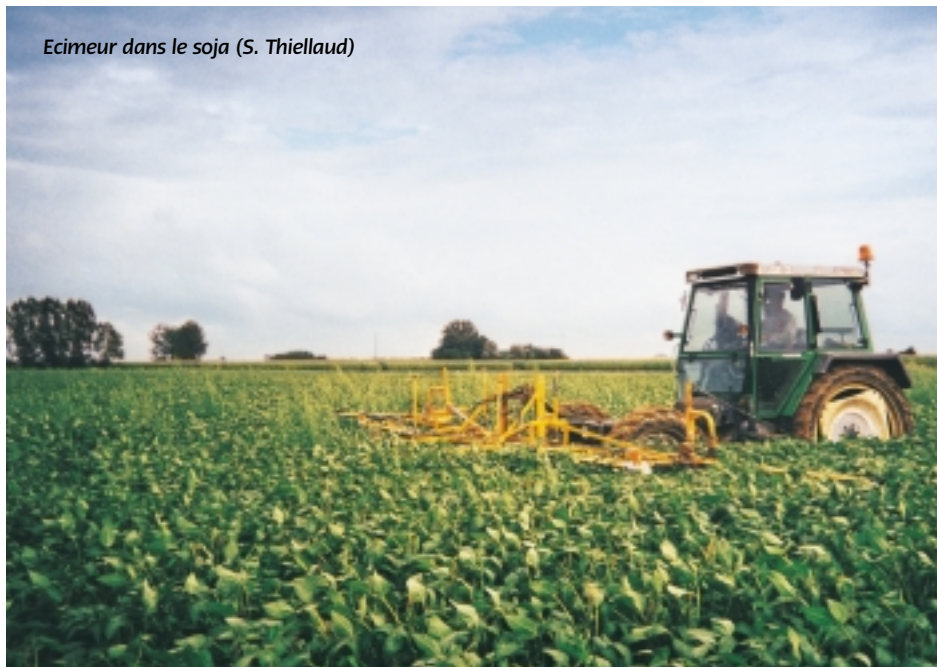
Ecimeur dans le soja (S. Thiellaud)