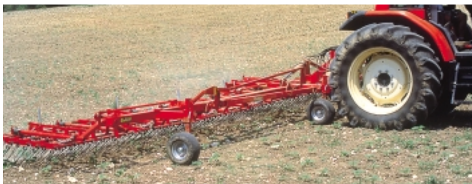
Herse étrille (CETIOM)

Le retour de légumineuses pluriannuelles peut aussi être une solution.