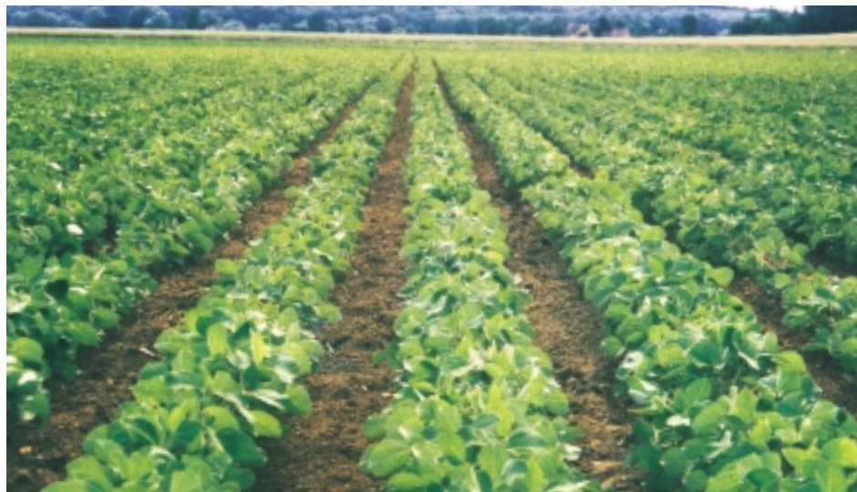
Soja après désherbage mécanique et thermique (O. Durant)